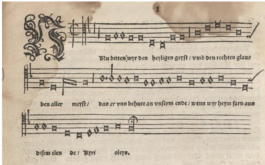
Illustration 2. Melodien til Luthers salme “Nun bitten wir den heiligen Geist” som nr. 1 i Johann Walters Geystliche gesangk Buchleyn , tenorbog, Wittenberg 1524. Public Domain. Online via: https://imslp.org/wiki/Geystliche_gesangk-Buchleyn_(Walter,_Johann) (set 31.10.2024).

Sangbogen er trykt som fem stemmebøger, og kun bassen og tenordelen er overleveret i førstetrykket. Tenordelen indeholder et register samt Luthers forord, som er velkendt i dansk sammenhæng, fordi Hans Thomissøn har det med i Den danske Psalmebog 1569. Her er det dog iblandet formuleringer fra Luthers senere forord til bl.a. den såkaldte Babstsche Gesangbuch fra 1545, der er den sidste samling af samtlige Luthers i alt knap 40 salmer udgivet i hans egen levetid. Første halvdel af det oprindelige forord lyder: